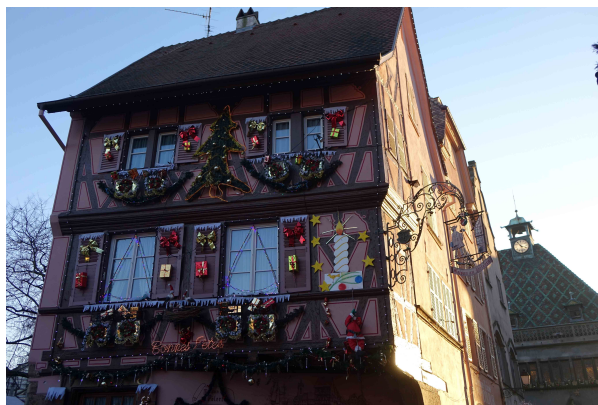
Cliquez pour télécharger le visuel

Les cours d'eau et les puits sont également décorés.