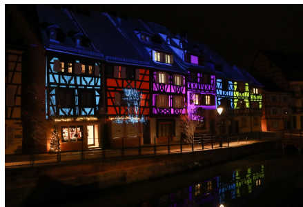
Cliquez pour télécharger le visuel

Cette opération permet de sublimer et de dynamiser les éclairages par des projections de vidéo-mapping et des jeux de lumières, sur une vingtaine de sites.