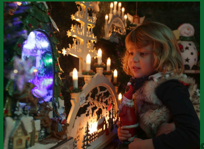
© Ville de Colmar - Cliquez pour télécharger le visuel

L'association "Les vitrines de Colmar" s'apprête à lancer durant le mois de novembre une plateforme d'achat en ligne, une "marketplace", rassemblant de nombreuses boutiques indépendantes Colmariennes. Un onglet "Noël" rassemblera les produits proposés habituellement par les artisans dans les chalets de Noël.