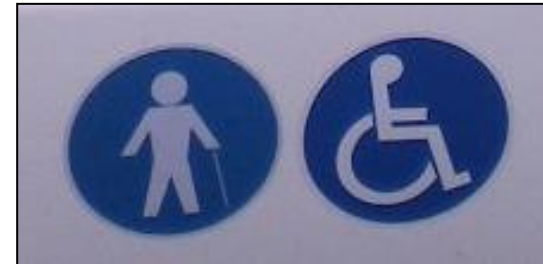
Icônes figurant sur les bus accessibles

➤ Utilisation d'un logo indiquant l'accessibilité aux personnes à mobilité réduite (sur chaque bus, sur l'horaire de passage de bus édité dans le guide, sur internet, sur la fiche horaire à l'arrêt).