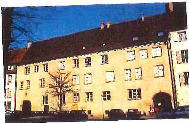
11, rue Turenne

L'un des bâtiments les plus importants de la Krutenau où se trouvait en 1922 une école (n° 11 rue Turenne / Musée d'Histoire naturelle), fut de tout temps une propriété de la Ville ; il provenait de la famille Zeiss. Dès 1467, la cour appartenait à la Ville qui en fit d'abord