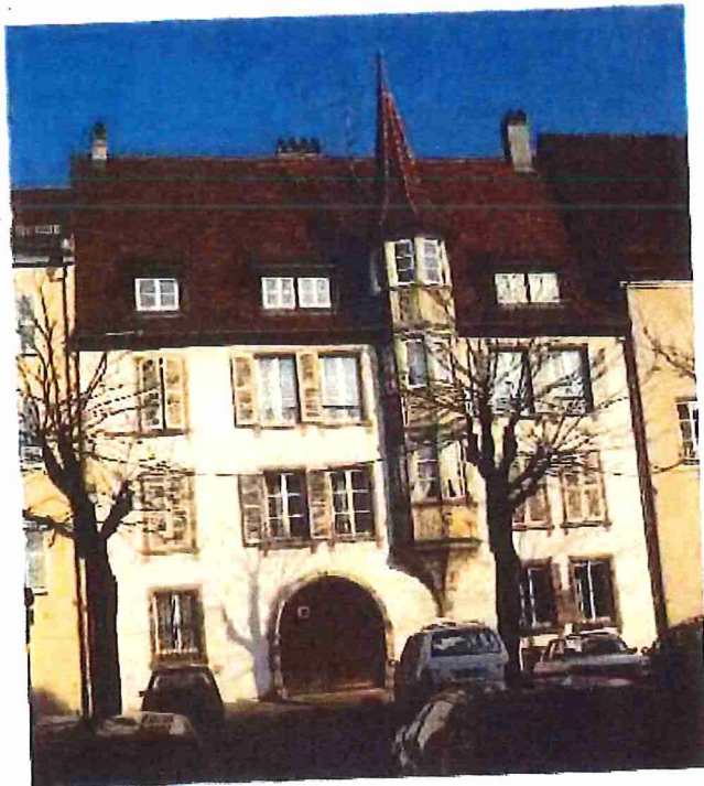
9, rue Turenne