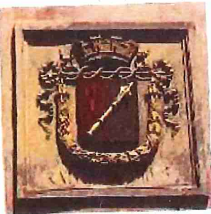
Armes de la ville de Colmar (11, rue Turenne)