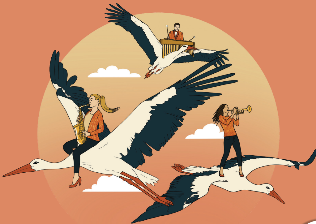
Illustration : Virginie Humbrecht